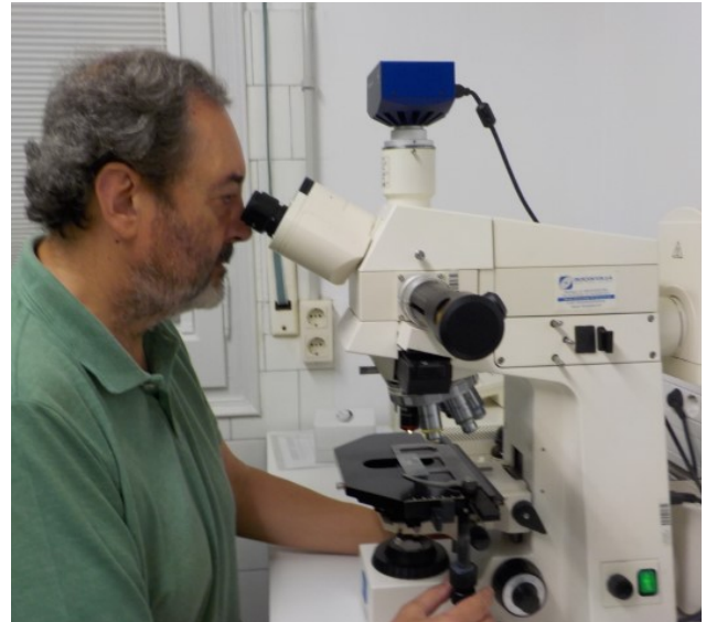
Una part important de la seva recerca la porta a terme al laboratori de la UB.

En aquest àmbit hem tingut molta sort de tenir el suport de l'Institut d'Estudis Catalans, que ens ha permès dissenyar i posar a disposició de la societat una pàgina web: Etnobotànica dels Països Catalans ( https://etnobotanica.iec.cat ). Consisteix en una ba-