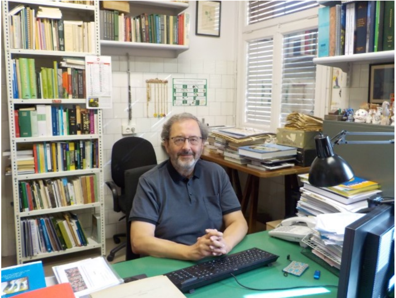
Al seu despatx al laboratori de la UB.

(abans Paris-Sud), a Orsay, on faig estades pràcticament cada any, més curtes o més llargues, des d'aleshores. Ella ha estat i és la meua mestra en l'àmbit de la citogenètica i en la determinació de la quantitat d'ADN nuclear. Cada vegada s'ha vist més que la mida del genoma és molt interessant en plantes per a aspectes sistemàtics, evolutius i d'adaptacions ecològiques. L'aparició de la biologia molecular i, més concretament, la tècnica de la PCR (reacció en cadena per la polimerasa) el 1983 i la seva aplicació a la seqüenciació del genoma de plantes, més endavant, va representar un salt importantíssim. És en aquest moment que iniciem aquesta línia de recerca, juntament amb la Dra. Teresa Garnatje –actual directora de l'Institut Botànic de Barcelona–, en el nostre equip d'investigació ( www.etnobioc.cat ), que forma part del Grup de Recerca en Biodiversitat i Biosistemàtica Vegetals (GReB, http://www.webgreb.net ). Ens hem centrat bàsicament en l'estudi de plantes de la família de les asteràcies, però també analitzem d'altres famílies. De cada espècie o grup d'espècies se'n seqüencia l'ADN i, per una banda, se n'estudia