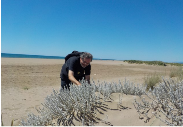
Recollint plantes a la Barra del Trabucador (Delta de l'Ebre).

m'hi vaig quedar a fer el doctorat. Al llarg dels anys m'he anat formant com a biòleg, començant per fer cursos de doctorat a la facultat de biologia. I, a la vegada, com que sempre m'han interessat les llengües i en concret la nostra, vaig estudiar filologia aprofitant que abans es feia al mateix edifici on es feia biologia, on vaig assistir com a oient a algunes classes d'aquesta llicenciatura.