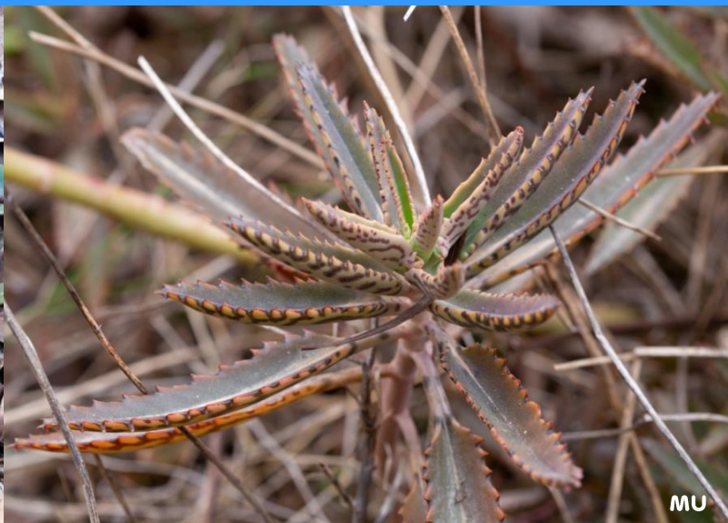
Kalanchoe x houghtonii ("milfills")

fulles triangulars amb un plec visible a la base i propàguls als marges